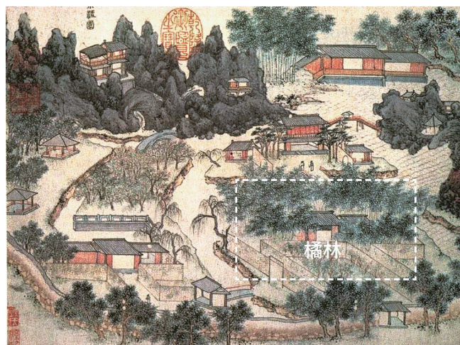
图3 明代钱穀《小祇园图》中橘林大致位置

随着“以素洁淡泊见品德，以幽雅野逸显高格”的宋型文化逐渐转型，宋人在植物欣赏层面上则是“弃貌求妙，鄙薄颜色，推求品格、精神”的状态 [23] 。此时对园橘的描写，更注重赞颂其香气。例如晏几道《鹧鸪天》“绿橘梢头几点春。似留香蕊送行人”，再如郑域“夹径翠香，黄绿分明……薰风自南，芳意未歇”所描绘的桂氏东园橘香清新的场景等，都展示出与前朝描写橘的形与色所不同的香气内容。这种清香气，在宋人眼中是雅致淡泊而不艳俗的美好品格，是构成园林美感的重要部分，由此出现橘下清谈对弈、静卧赏景闻香的画面。此外，在生活上，人们常采园中橘花，佐以素馨、茉莉“相轧”并“取以蒸香”，用于身上配香及衣物熏香 [24] 。种种迹象都表明，宋人对橘的欣赏进入了更加细腻的境地。