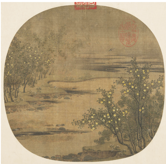
图1 宋代赵令穰《橙黄橘绿图》 Fig.1 Orange and Green of Tangerines and Oranges by Zhao Lingrang of the Song Dynasty