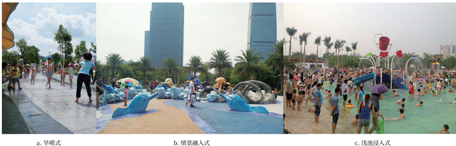
图1 广州儿童公园的3种类型戏水场地