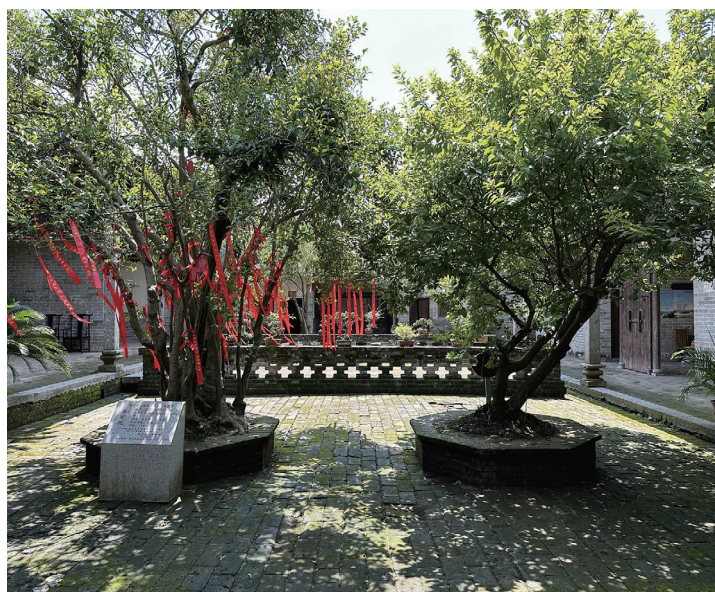
图3 钦州浦北县大朗书院内花园

Fig.2 Wenlong Academy in Bobai County, Yulin