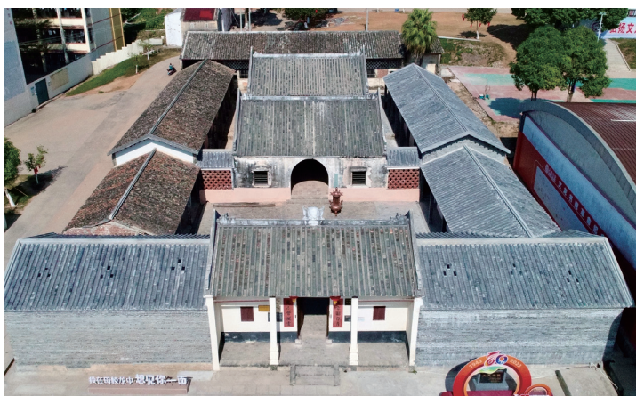
图2 玉林博白县文龙书院

部分广西书院的命名是为了纪念名人先贤,如武鸣的阳明书院是为了怀念先人王阳明,钦州的东坡书院是为了纪念苏东坡,宜州的龙溪书院是为了纪念黄庭坚,横县的淮海书院是为了纪念北宋词人秦观(淮海)。