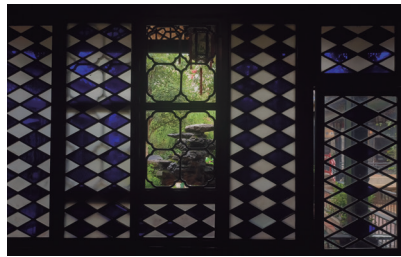
图2 卧瓢庐四季窗 Fig.2 Four Seasons Window of Lying Cottage

传统岭南建筑擅长运用2种及以上颜色的彩色玻璃窗与光线、环境共同作用，以丰富室内空间体验。余荫山房卧瓢庐的菱形蓝白套色满洲窗又称四季窗（图2），透过单层蓝