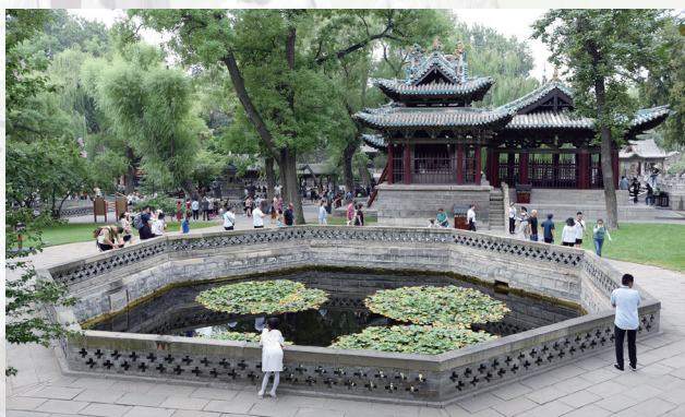
唐叔虞祠前的八角莲花池