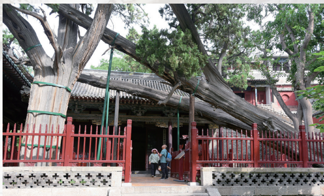
苗裔堂前的卧龙柏

丰厚，集中国古代祠祀建筑、园林、雕塑、壁画、碑刻艺术为一体，在国内外久负盛名。1961年被国务院公布为第一批全国重点文物保护单位。晋祠博物馆总平面呈矩形条状，建筑主轴为东南至西北朝向，总体布局可分为中、左（东北部）、右（西南部）三大部分。