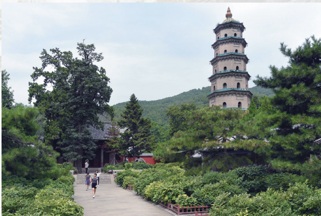
奉圣寺舍利生生塔