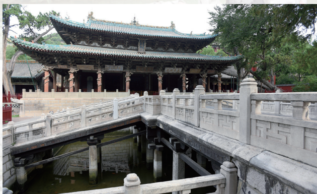
圣母殿前的鱼沼飞梁