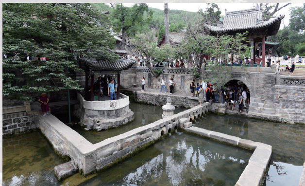
真趣亭与智伯南北渠的三七分水界水坝