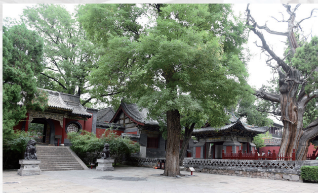
昊天神祠与东岳祠门前古树