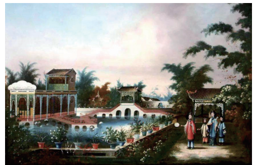
图3 外销画中的馥荫园