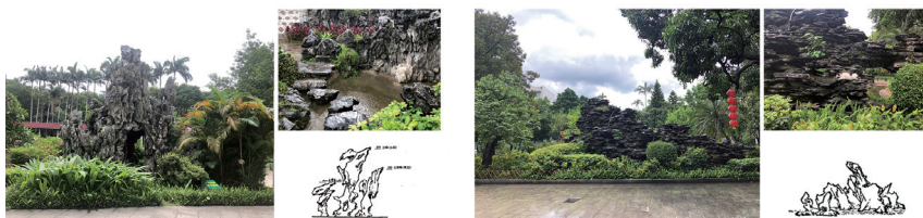
图6 醉观园三峰石景