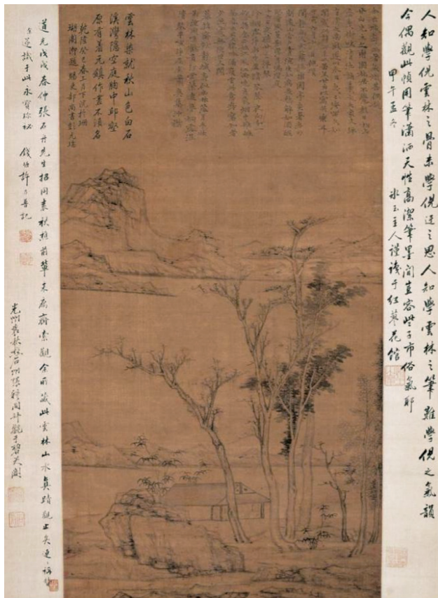
图3 倪瓒《乐圃林居图》轴

不宁唯是，绘画与园林本体和文本之间存在着明显的反差，它们在空间上的“互文”的模糊性弱化了园林的边界和景观的真实性，唤起作为修辞、媒介的园林的想象力，扩展了“园林”的空间话语。图景所表达的“境”（包括自然环境和园林意境）也是园主人心境的投射，折射出土人对时局的感慨与抉择之间的无奈。在元代士人的眼中，园林的实际景象并不重要，而园林所处的环境及其产生的景境效果才是首要的，这是画中要突出强调的，也是园主达到“内和”的闲适之态，使内心深处得以慰藉的所在。