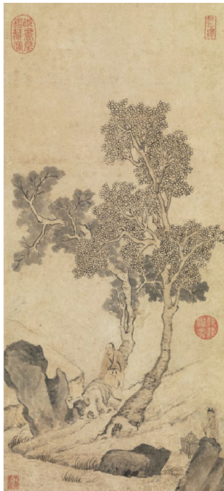
图2 《乔林煮茗图》局部