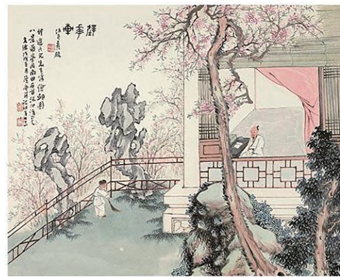
图10 居廉《邱园八景图·壁花轩》