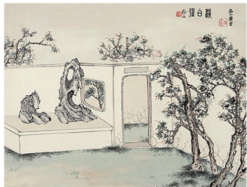
图 2 居廉《邱园八景图·淡白径》