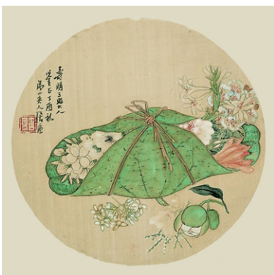
图7 居廉《采花归扇面》