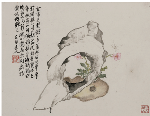
图 1 居廉《花春四时》中绘堇菜

由于岭南夏日天气酷热，庭院建筑多以廊道相通，形成连廊广厦的格局。廊多以藤花攀附，形成花廊，营造出立体丰富的花卉种植景观，同时增强降温效果，提供纳凉空间。可园中名为“花之径”的曲折小径上便曾设置花廊架，沿花径一路延伸至可楼，上面攀援着紫藤与炮仗花 Pyrostegia venusta 。小径两侧设置花基，种茉莉花、栀子 Gardenia jasminoides 等香花，为行走其间的人带来了沉浸式的体验，居巢称“人穿花里行，时谓惊蝴蝶” [7] 。从“二居”的画作中推测，庭院内常见的藤蔓植物应有凌霄 Campsis grandiflora 、炮仗花、牵牛花 Ipomoea nil 、紫藤、忍冬 Lonicera japonica 、夜来香、清香藤 Jasminum lanceolaria 等。