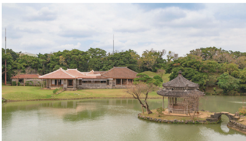
图3 识名园中的御殿与六角堂