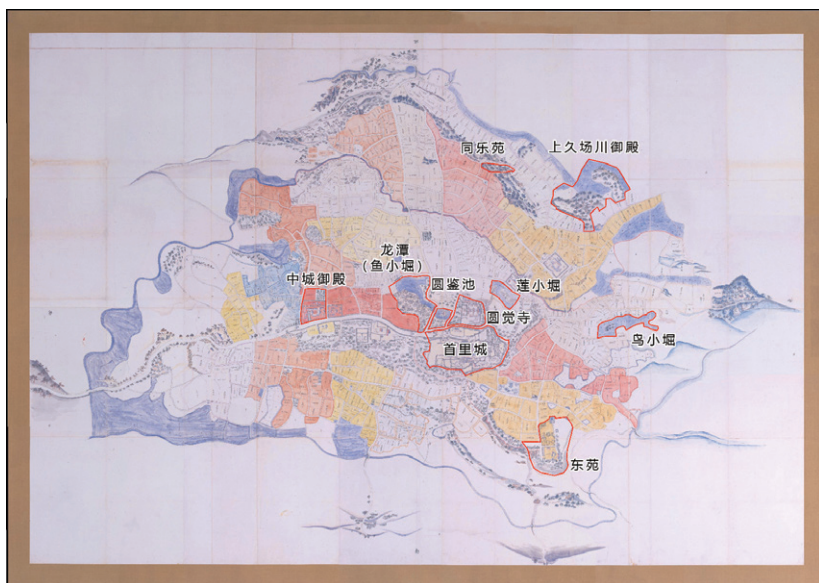
图2 《首里城古地图》中的王族园林分布