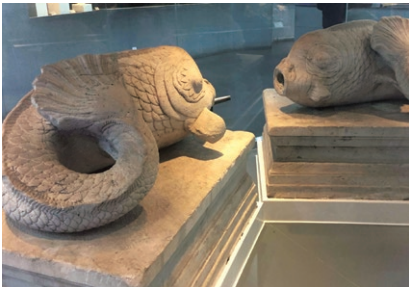
图5 圆明园遗存鱼形装饰雕塑

与先前文人的“清高”标榜不同，该时期将园林看作个人“享乐”与社会交往“众乐”的场所 [25] 。普遍化源于养鱼技术成熟、赏鱼风气盛行，以鱼增加趣味性、与动态美，其背后是人们将园林视为身份与财富的象征，追求更高质量的生活。多样化体现在出现盆养金鱼、西式石雕等多种形式，且相较宋代，清朝皇家权威逐渐提高，以“鱼藻”等元素歌颂皇帝并作为帝王应天承运的符瑞再次突出。盆养金鱼的出现除技术因素外，更是受到“小中见大”的园林造景手法以及“壶中天地”的造园思想影响 [26] 。清中叶因经济繁荣，世俗化逐渐加重，帝王多抒发俯瞰万类的帝王之怀 [27] ，士人追名逐利、渴望入仕，如“鱼跃鸞飞”这类在向往鱼鹰自由的同时渴望飞黄腾达、仕途顺利的形象不断加强。清末鱼元素