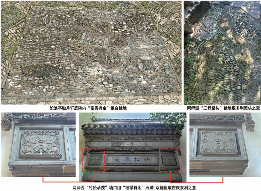
图 2 祈求祥瑞的鱼形装饰

业养殖金鲫鱼的职业，促使原为上流社会独享的金鱼观赏逐渐走向了寻常百姓家 [20] 。花鱼鉴赏、诗词歌赋成为重要的园林娱乐活动。此时期鱼元素景观形式呈现文人化的趋势，鱼形装饰也不局限于祈求祥瑞