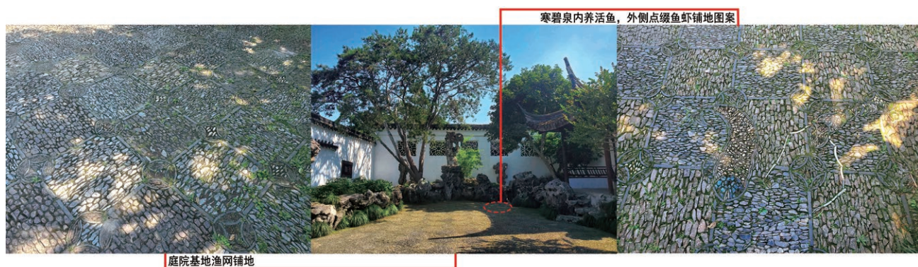
图3 网师园殿春簃庭院突出“渔隐”之意

该阶段在天人合一的造园理念下，人们有意识地布置鱼池景观，并出现喂食等互动活动。更为突出的是造园理念文人化，自然审美观念逐渐生活化，园主人渴望以园林生活暂时摆脱世俗的打扰，从而获得一种回归自然、淡泊名利的生活