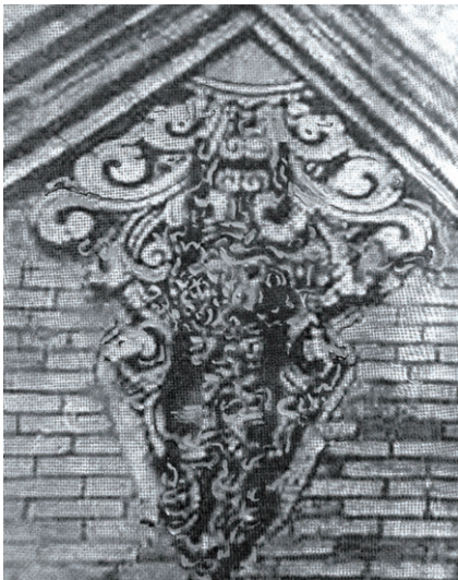
图1 唐草纹悬鱼纹饰