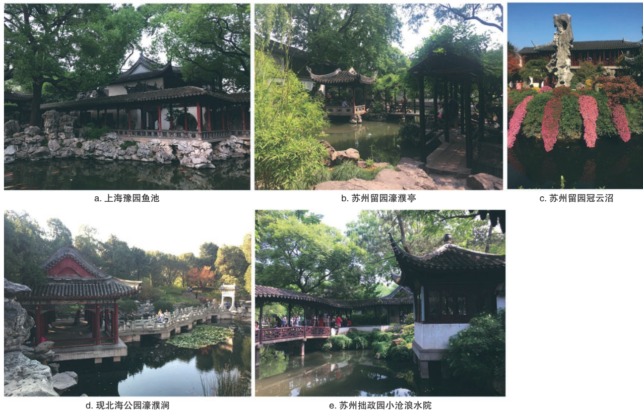
图4 明清园林鱼池景观