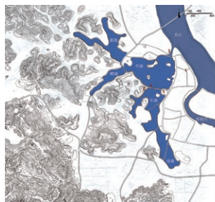
图1 当代惠州西湖水域范围

《惠州府志》记载：“惠州府城在省城东南三百里，明洪武三年知府万迪始建，故城甚隘，今钟楼即南门，平湖桥西门，城隍庙北门” [6-9] 。推测明初之前惠州故城范围相对较小，大致坐落于西湖和东江、西枝江之间。城北门在今城隍庙，而“府城城隍庙在府署西” [6] ，可知城墙北不过桵山；西门在平湖桥，即公卿桥，大致在明、清时鹅湖范围，鹅湖宋时为西湖水域 [1] ；钟楼故址在今中山南路南端，宋城南门附近。以上便可推想宋代惠州城故址的大致范围，并进一步研究湖与城的关系。