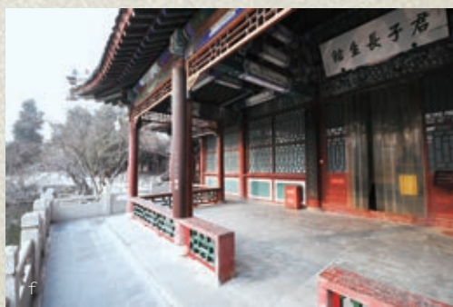
a 篇留洞假山 b 观澜亭 c 藻泳楼 d 临漪亭 e 高芬阁 f 君子长生观