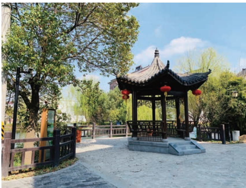
图9 亲水休闲平台改造