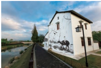
图6 村宅建筑墙绘风貌