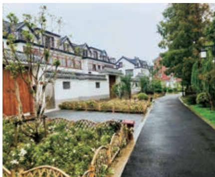
图7 宅前屋后小花园