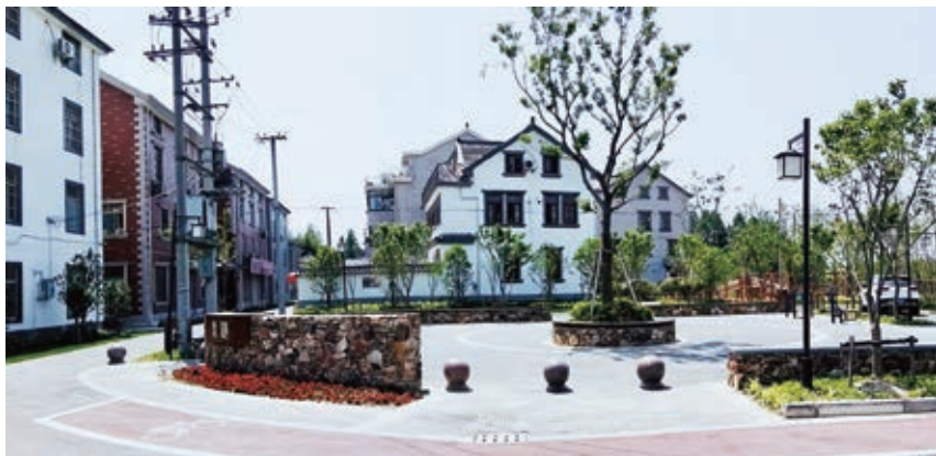
图8 村民活动广场改造

包含医疗、教育、环卫、安防、通信等设施，是美丽乡村的后勤保障。建设美丽乡村，不是简单体现在整治村宅风貌的“外在美”上，也要提高配套供给水平，提升乡村老百姓的社会保障，体现“内在美”。需合理设置乡村的基础配套服务设施，推进美丽乡村基本配套服务均等化，使得乡村拥有与城镇相同的现代化生活条件设施 [7] 。利用严家湾的存量建筑改造成党建服务站，成为了村里党员议事的固定阵地；内含漕运文化展示馆，为村民及外来游客了解华漕的文化提供了窗口；同时也服务于村民，成为赵家村舞蹈团排练舞蹈的地方。对现有厕所进行改造升级，并在每家每户门口设置分类收集垃圾桶，通过各式各样的木制宣传栏，宣传文明乡风。同时还完善了监控、照明等基础配套，提高村民生活的安全性及便利性。