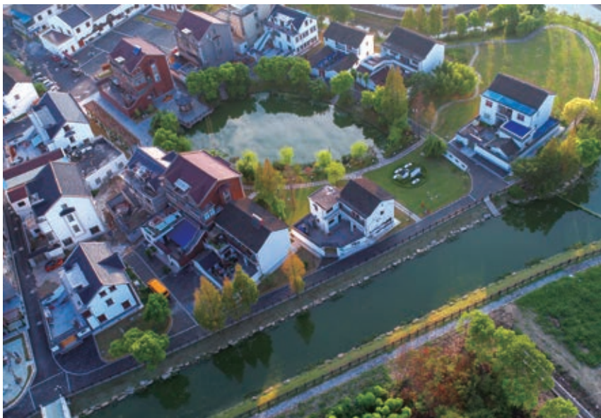
图 10 整体鸟瞰风貌