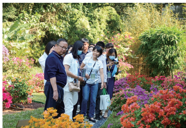
参观新优园林植物

本次会议的学术研讨内容丰富且有深度, 各位嘉宾依托科研机构、高校与企业等不同组织基础, 针对运用园林植物缔造高质量的人居环境、挖掘新优植物品种等议题, 分享了很多新技术、新思路和新成果, 深入探讨了在贯彻落实中央生态文明建设新要求的背景下, 如何更好地发挥风景园林行业的作用, 以响应美丽中国、公园城市等建设需求, 共同推动生态文明建设的全面发展, 建设可持续性的人居环境。