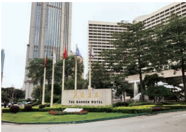
图3 改造前入口广场