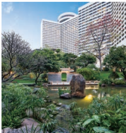
图7 改造后后院景观