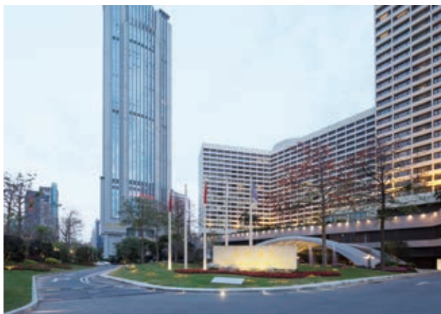
图4 改造后入口广场

Podocarpus macrophyllus 和造型榕树 Ficus microcarpa 等, 结合景石布置, 打造岭南韵味景观环境。同时, 将大堂入口正对的停车位改造成绿化种植空间, 在保留原有上层高大乔木的基础上, 堆坡造景, 塑造微地形, 拓展下层草坪空间, 突出景观轴线感, 提高人们的视觉感受 (图3~4)。在夜景方面, 利用现代科技措施, 将水景与新型灯光结合, 在夜间营造出草坪“繁星点点”之景象, 打造舒适的音乐喷泉。总体来看, 精简背景、景观层次梳理完善后的入口广场景观, 视线简洁通透, 可有效聚焦游人视线, 成为引导空间序列的起点。