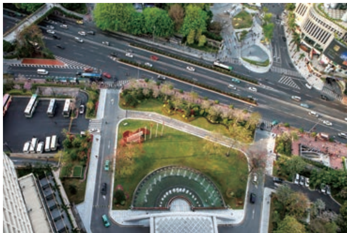
图2 入口广场景观鸟瞰图