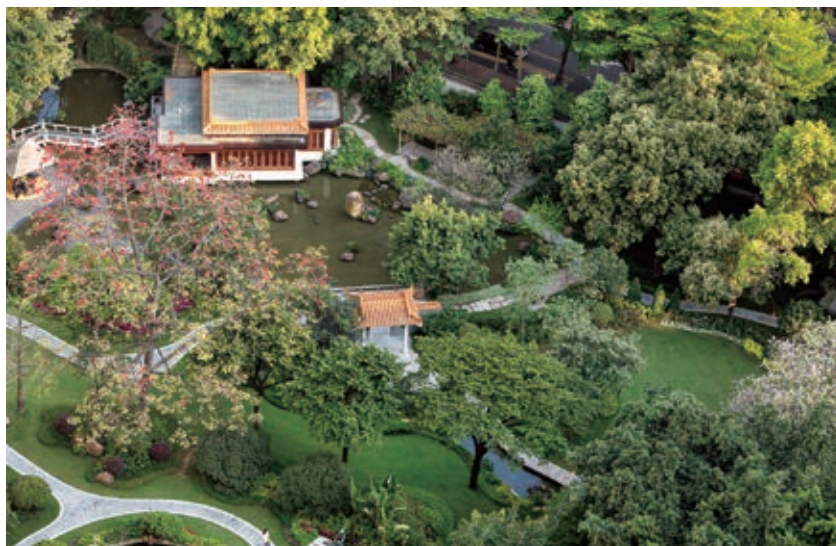
图5 后院景观鸟瞰图