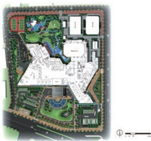
图1 花园酒店总平面图