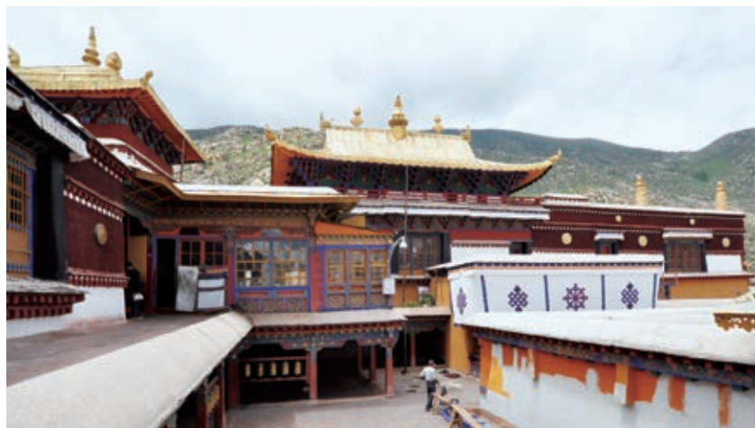
措钦大殿后部“堆松拉康”的三世佛殿