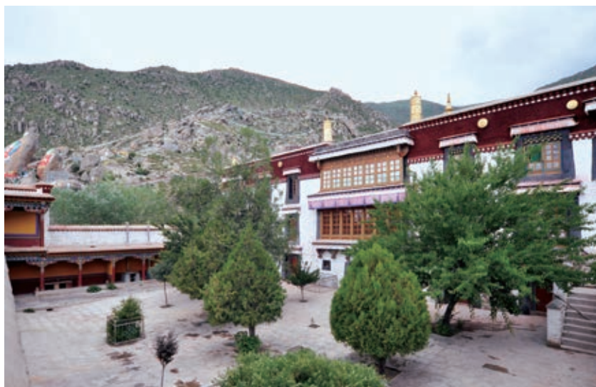
甘丹颇章第三层平台院落