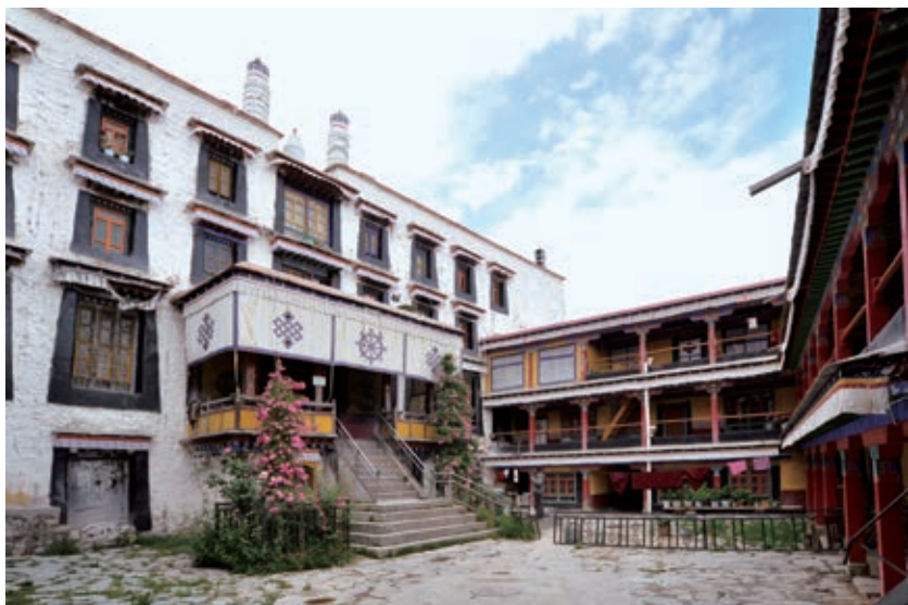
甘丹颇章第一层平台小院