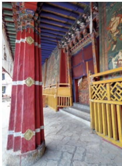
罗赛林札仓经堂入口檐廊