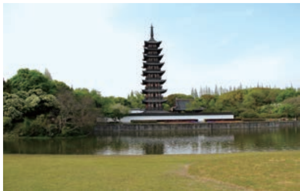
图2 宋塔及塔院院墙