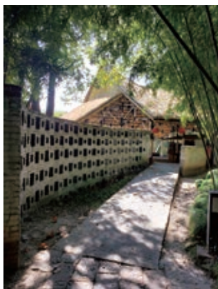
图6 何陋轩弧形墙体